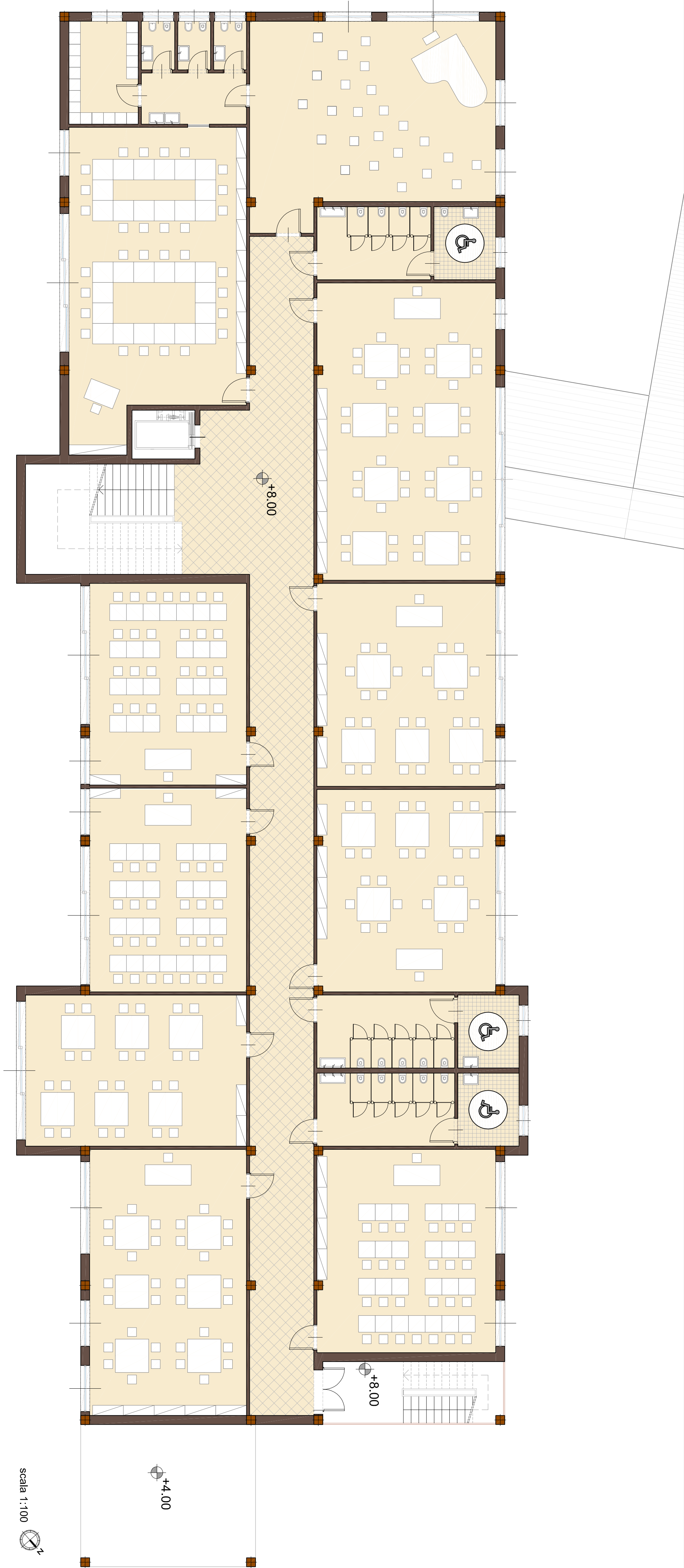
PIANTA PIANO SECONDO